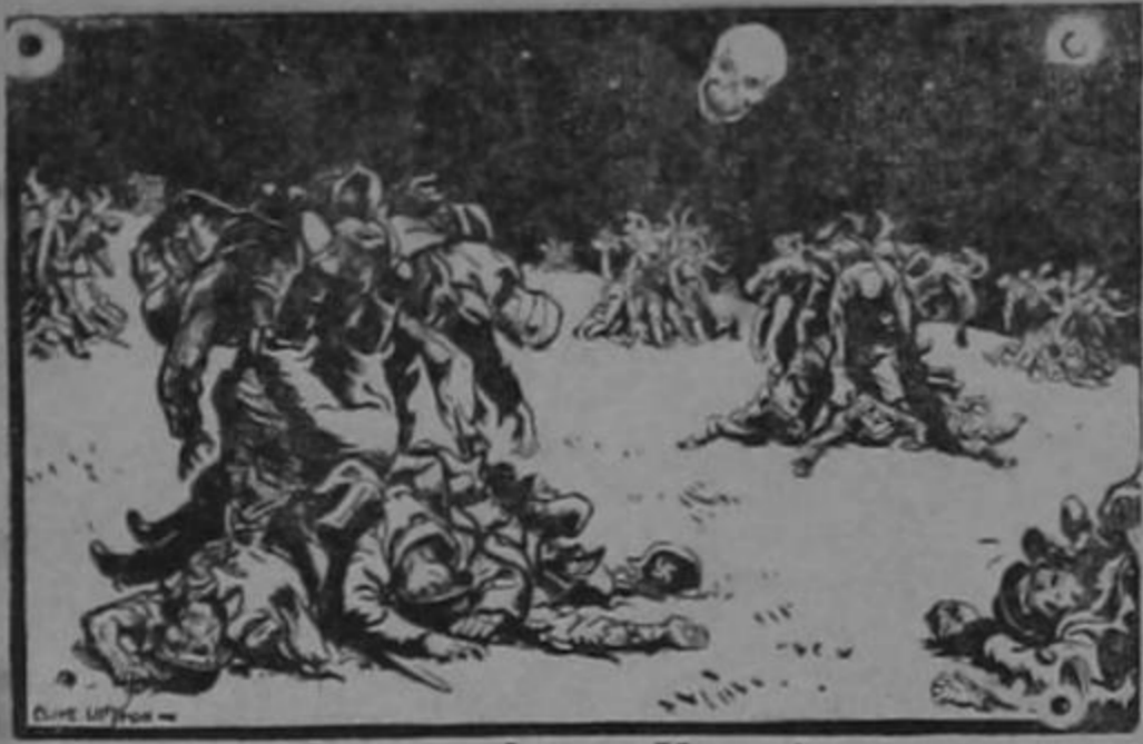
La cosecha en Ucrania