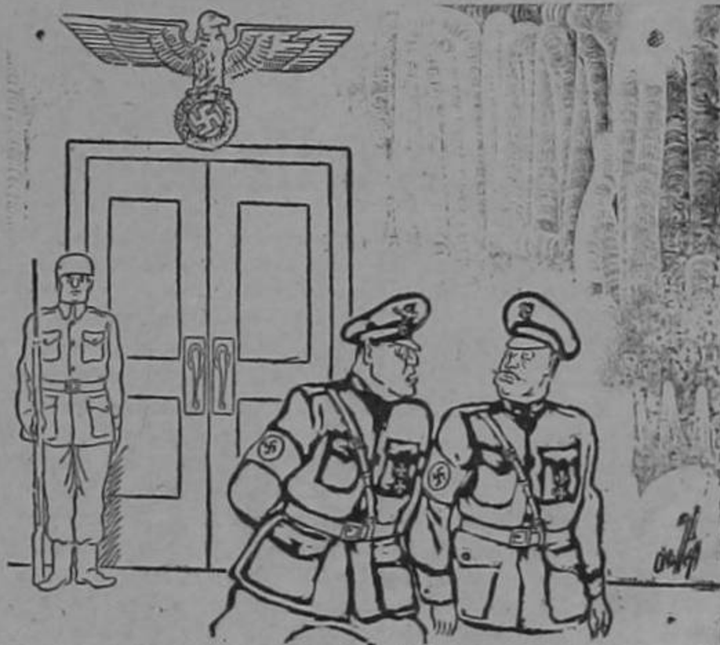
"El fuehrer ha tenido otra inspiración, y el General von Steitcheitch ha muerto como consecuencia..."

"Ninguna ingerencia tuve en esa publicación, ni podía tenerla porque estaba ausente de la ciudad desde el día anterior, DE IGUAL MODO QUE GUARDABA CA-