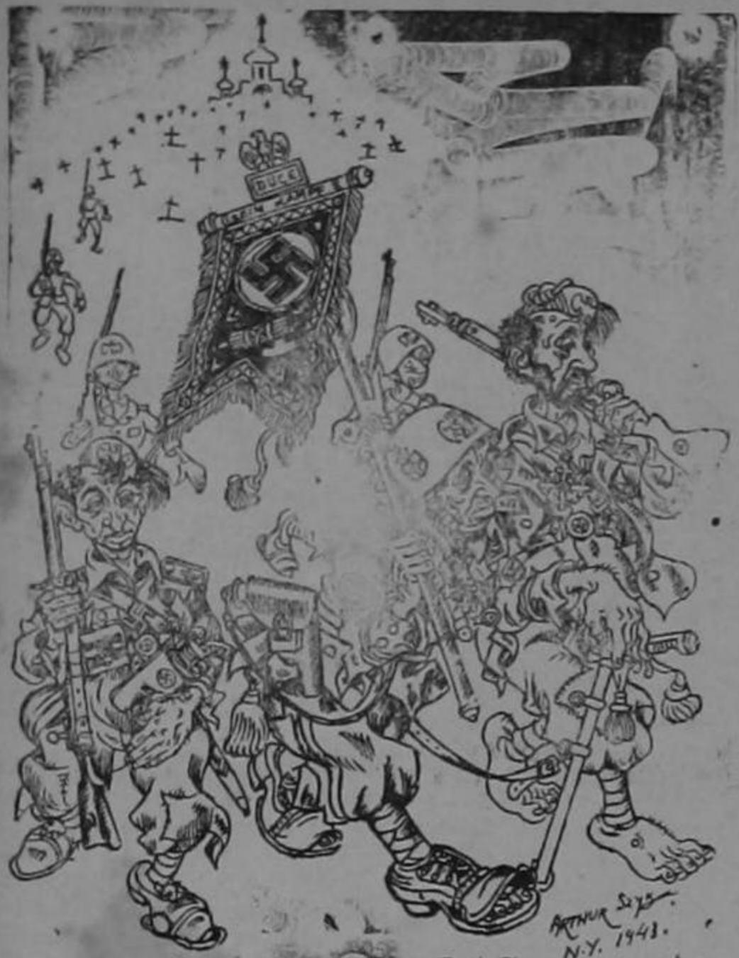
"Los italianos se están retirando de Kusia..."