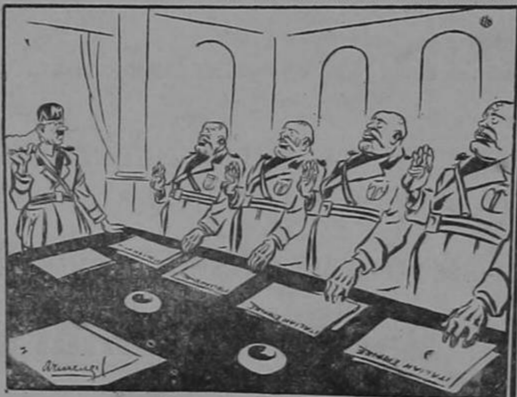
El nuevo Gobierno

Al respecto lo único que cabe decir es que nos parece mentira que siendo tan viejo, sea tan mentiroso!