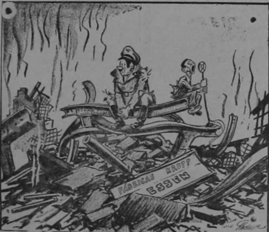
Goebbels: "Nos destruyen hospitales, iglesias, colegios...!"