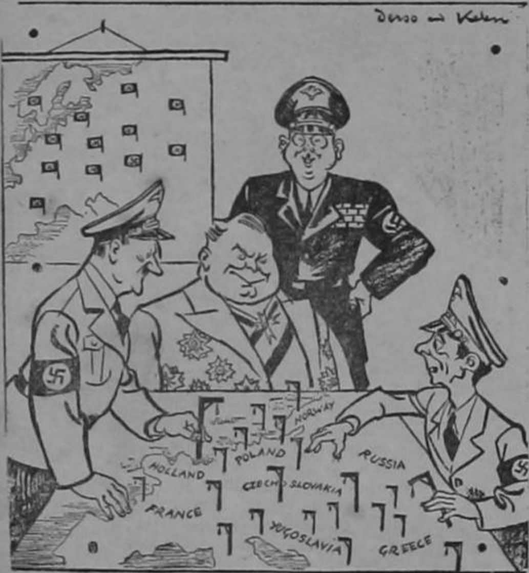
La granestrategia del Eje

En consecuencia y como sólo queda una calle sin bautizar, esa de hecho será la que pedirán para don León Cortés: la del Hospicio de Locos. Al menos en eso hay una visible asociación de ideas.