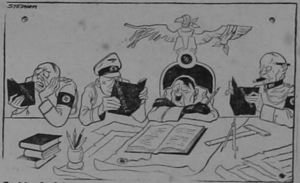
Quién hubiera pensado que esto nos sería útil...!

Milwaukee Journal. Joy Homer en This Week Magazine.