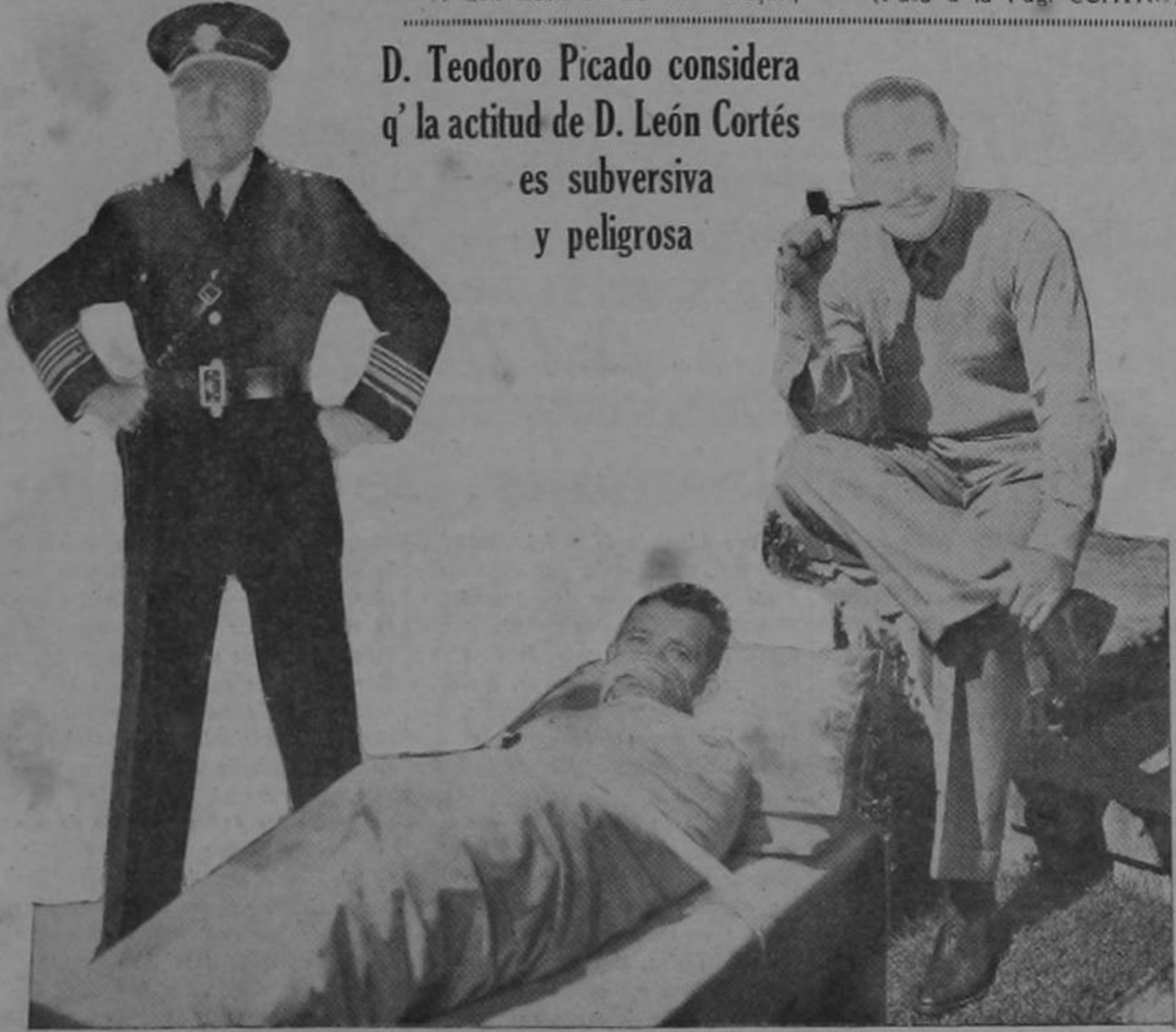
TEODORO: —Vea coronel, este es el hombre de los ataques. Lo malo es que ahora el ataque le dió a él, y muy feo. Yo creo que el pobre está de que lo amarren.

D. Teodoro Picado considera q' la actitud de D. León Cortés es subversiva y peligrosa